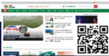
Website LUẬT SƯ FDVN fdvn.vn