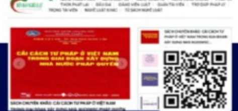
Website Diễn đàn nghề luật diendanngheluat.vn