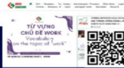
Website FDVN LAW FIRM fdvnlawfirm.vn