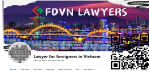
Facebook Lawyer for foreigners in Vietnam