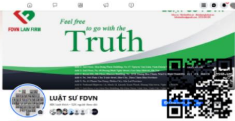
Facebook LUẬT SƯ FDVN