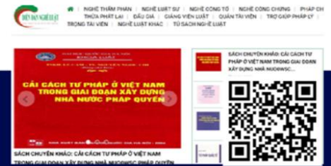
Website Diên đàn nghề luật diendanngheluat.vn