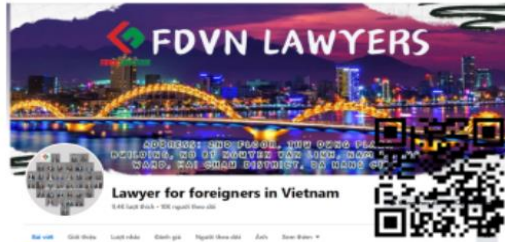
Facebook Lawyer for foreigners in Vietnam