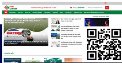
Website LUẬT SƯ FĐVN fdvn.vn