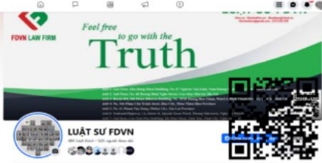
Facebook LUẬT SƯ FĐVN