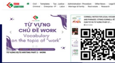
Website FĐVN LAW FIRM fdvnlawfirm.vn